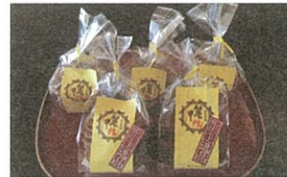
えちごや 越後屋 べっこう焼き