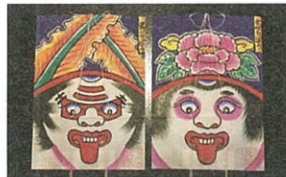
のしろたご 能代風 (べらぼう風)