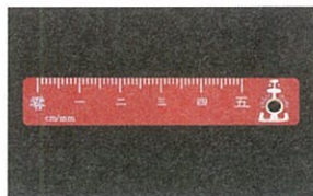
ひらやま 平山はかり店 漢字定規