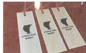
あきたすぎ 秋田杉しおり