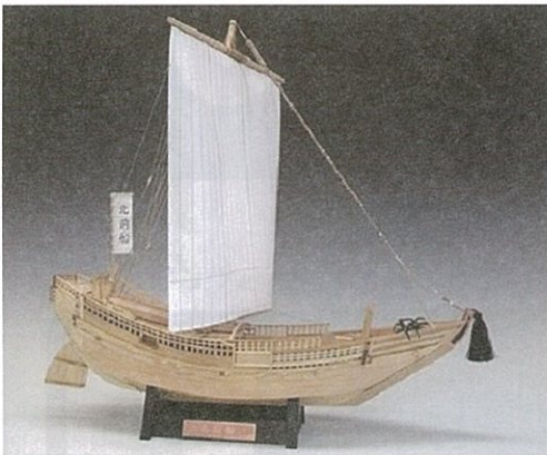
きたまえぶねもけい 北前船模型 1/72

北前船に関するお店でスタンプを集めて、金勇でクイズに答えて、くじを引こう。抽選で景品をもらおう！ お一人さまにつき、スタンプラリーの参加は一回のみとさせていただきます。（くじも一回のみになります。）