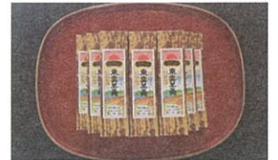
しのめようかん 東雲羊羹