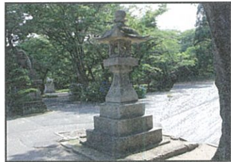
はちまんじんじゃごしんとう 八幡神社御神燈