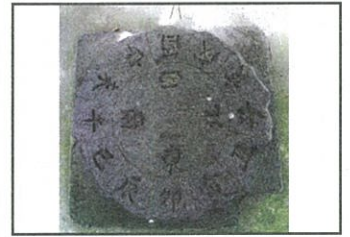
ひよりやまほうがくし 日和山方角石