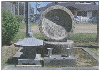
ひきうすのはか（こうきゅうじ） 挽臼の墓（光久寺）