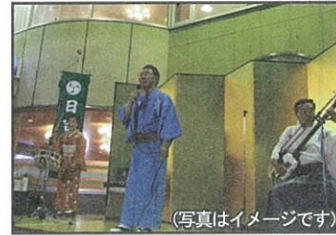
のしろふなうた 能代舟唄