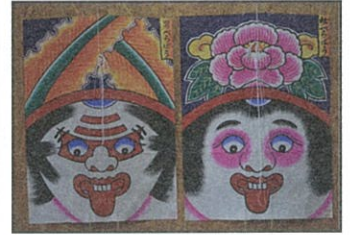
のしろだこ だこ 能代凧（べらぼう凧）